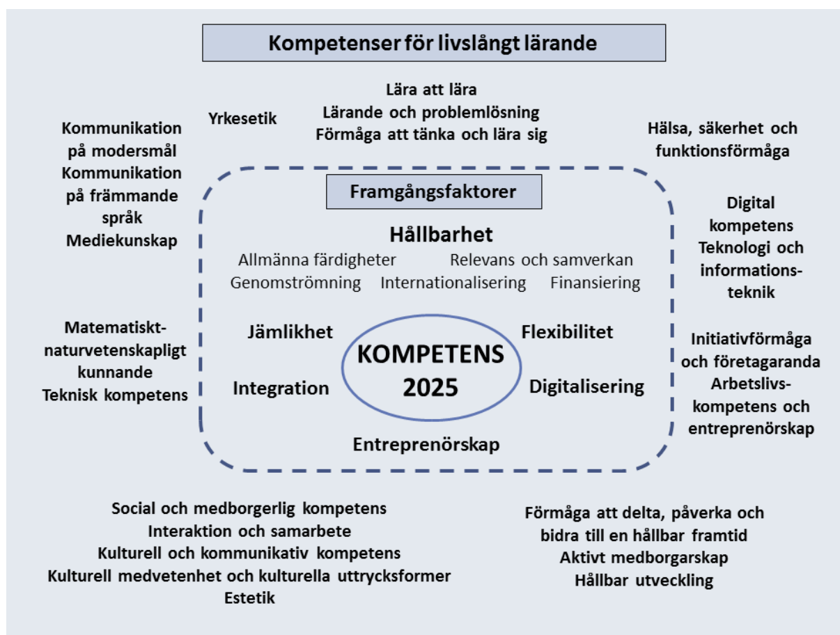
Bild 1. Framgångsfaktorer för åländsk utbildning

Den åländska utbildningen är beroende av utvecklingstendenser i ett omvärldsperspektiv. De kompetenser för livslångt lärande som individen behöver inneha i en globaliserad ekonomi är generella och gäller således på Åland liksom i vår omvärld.