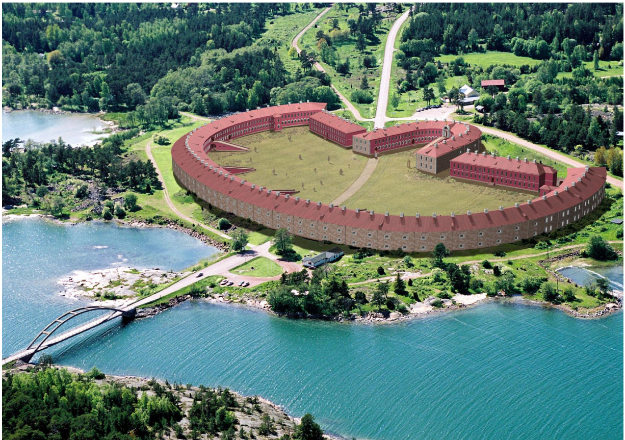
Visualisering av Bomarsunds huvudfäste i dagens miljö.

Ålands landskapsregering vill stärka utvecklingen av Bomarsund genom att förverkliga ett besökscenter i området. Med den här rapporten presenterar arbetsgruppen sitt resonemang kring och förslag till besökscentrets placering, dimensionering och innehåll. Arbetsgruppen konstaterar att besökscentret skall byggas på samma plats som har föreslagits tidigare. Byggnaden blir till ytan något mindre än det tidigare förslaget och den interna rumslösningen skall möjliggöra en flexibilitet i verksamheten. I utställningen används högkvalitativ teknik för att förmedla historien om det dramatiska mötet mellan ålänningar och omvärlden som lade grunden till Ålands unika status i dagens värld. Med ett innehåll som riktar sig till besökare utifrån kommer besökscentret att stärka besöksnäringen på Åland. Arbetsgruppens arbete har legat till grund för de skrivelser som finns i 2019 års budget.