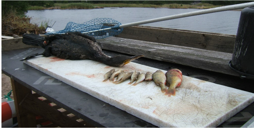
Maginnehåll från en skuten skarv, 9 st. abborrar ( Perca fluviatilis ). Åland, oktober 2009.

På Åland satsas stora resurser på fiskevårdande åtgärder. Under våren och hösten sätts årligen ca 2,5 miljoner fisk och fiskyngel ut i havet. En tid efter utsättningen kan dessa fiskar uppehålla sig inom ett mycket begränsat område och utgör således lätta byten för skarvarna.