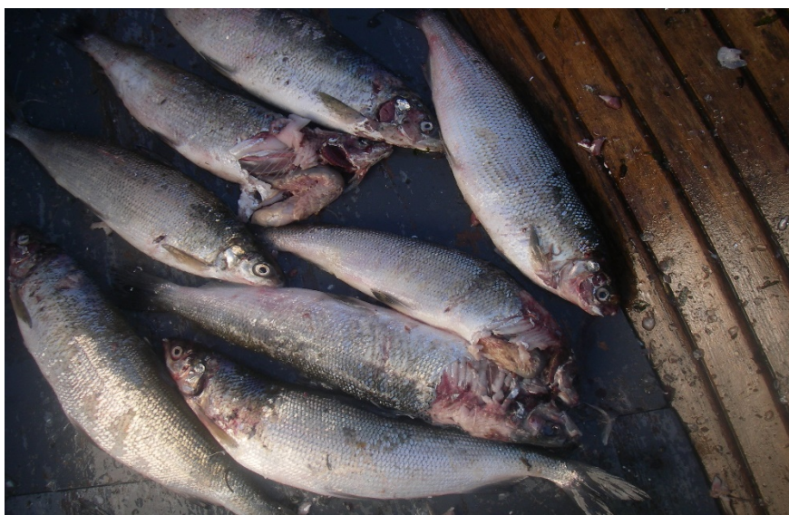
Bild av skarvättna sikar ( Coregonus lavaretus ), Åland september 2009.

Det åländska fisket bedrivs i huvudsak med bottengarn på relativt grunt vatten. Dessa nät är lätta för skarvarna att vittja, vilket medfört stora problem för yrkesfiskarna. Problemen är främst skador på fisk och redskap, uppäten fisk samt att fisken skräms från fiskeplatserna.