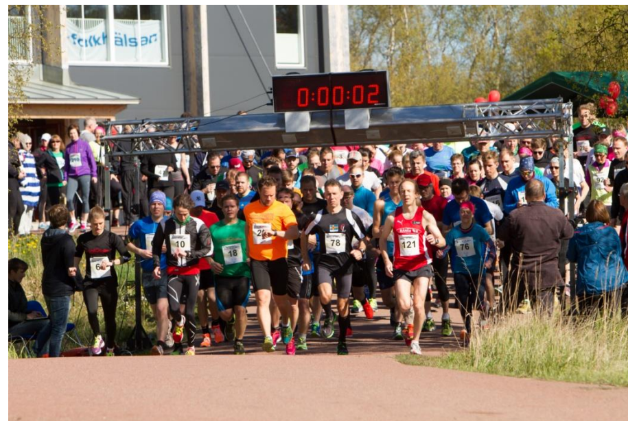
Brändöluften, fotograf Jana Lemberg

Vanligt förekommande var åsikten att pappershanteringen bör förenklas vilket t.ex. kan åstadkommas genom rådgivning samt att informationen om Leader bör nå ut till fler.