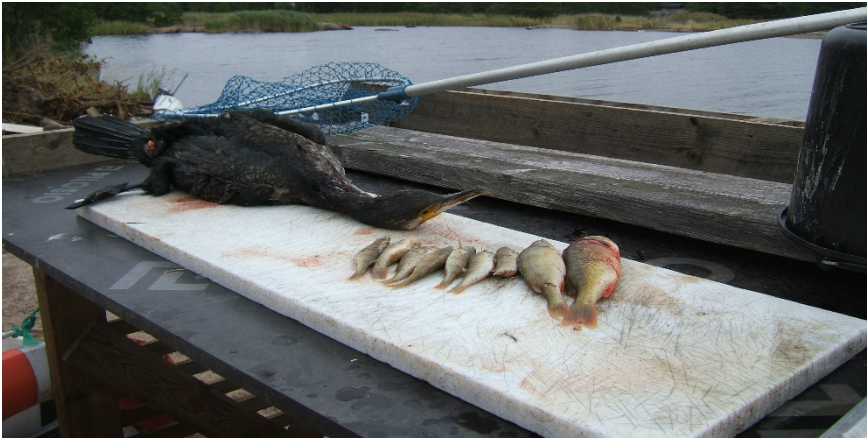
Maginnehåll från en skuten skarv, 9 st. abborrar ( Perca fluviatilis ). Åland, oktober 2009.

På Åland satsas stora resurser på fiskevårdande åtgärder. Under våren och hösten sätts årligen ca 2,5 miljoner fisk och fiskyngel ut i havet. En tid efter utsättningen kan dessa fiskar uppehålla sig inom ett mycket begränsat område och utgör således lätta byten för skarvarna.