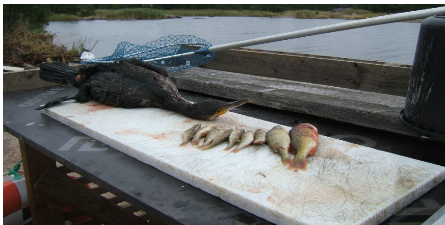
Maginnehåll från en skjuten skarv, 9 st. abborrar ( Perca fluviatilis ). Åland, oktober 2009.

Det är den extremt snabba populationsökningen som är grunden till dagens skadesituation. År 2003, då handlingsplanen för hantering av skarvbeståndet i landskapet togs fram, fanns i princip inte några skador av skarv. Problemet är att en stor del av påverkan är svår att verifiera då skadorna är dolda i form av bortskrämda och uppättna fiskar. Det torde dock stå utom alla tvivel att skarven hotar återväxten hos ekonomiskt viktiga fiskbestånd och att skadan är att betrakta som allvarlig.