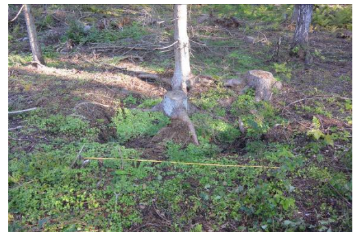
Översiktsbild från söder, A160831_04.JPG. Foto från inventering 2016.