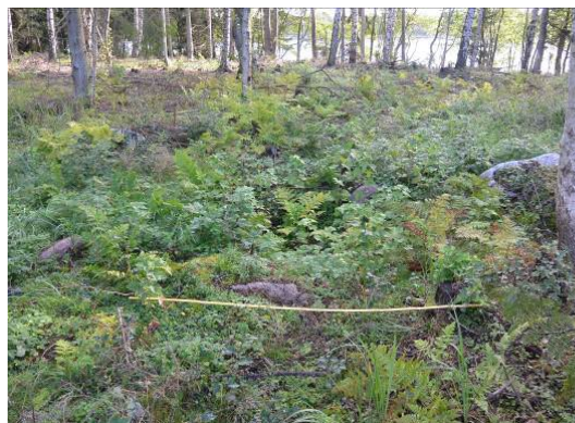
Översiktsbild från sydväst, A160831_07.JPG. Foto från inventering 2016.