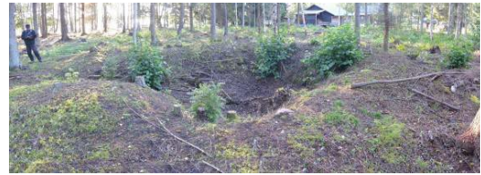
Översiktsbild från nordväst, A160831_02.JPG. Foto från inventering 2016.