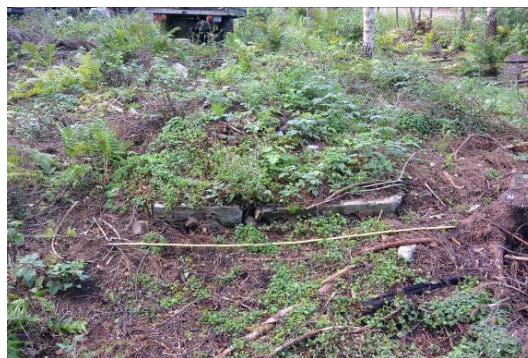
Översiktsbild från väster, A160831_05.JPG Foto från inventering 2016.