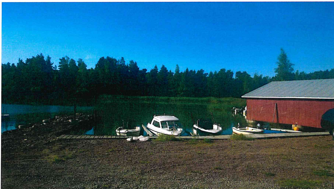
Figur 1. Panoramabild över det planerade muddringsområdet mot söder. Foto: M. Lindholm, C170811_04.JPG.

Vid besiktningen vilket skedde med båt av platsen för den föreslagna muddringen och uppläggsplatsen för muddermassorna på Söderby samfällighets mark kunde det konstateras att inga antikvariska hinder föreligger för de föreslagna arbetena. Det kunde också konstateras att muddringsarbetena inte kommer att påverka den maritima fornlämning, M1 Le 418.5, som ligger cirka 20 meter öster om muddringsplatsen.