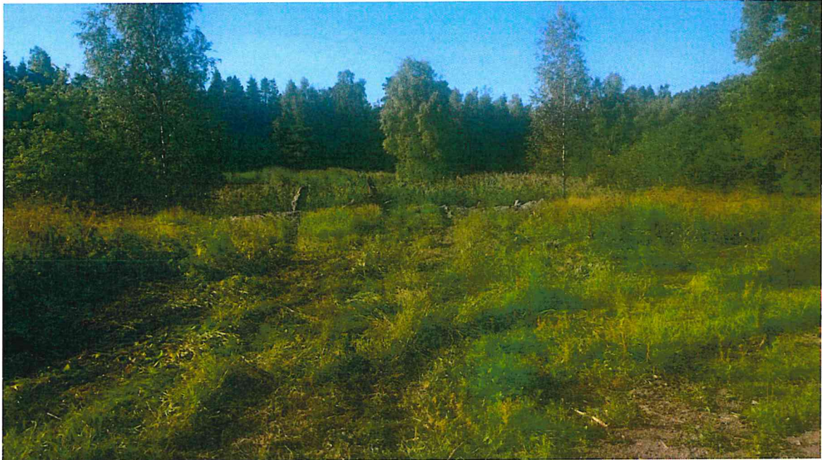
Figur 2. Översikt över uppläggningsplatsen för muddermassorna. Foto mot söder. Foto: M. Lindholm, C170811_07.JPG.