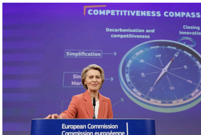
Kommissionens ordförande Ursula von der Leyen i samband med att kompassen publicerades