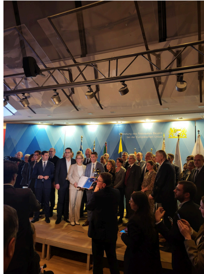
Åland var inbjudna till Bayerns representation för ett event om regioner och sammanhållningspolitik.