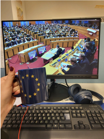
I början av November gick ganska många timmar åt att lyssna på kommissionshöranden.