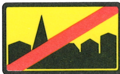
507b. Tätort upphör.