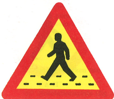
Förmärke för övergångsställe