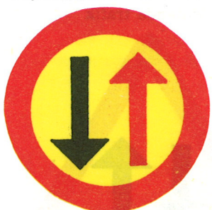
Väjningsplikt vid möte