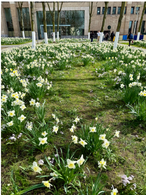
Ett tydligt vårtecken är haven av Påskliljor i Bryssels många parker