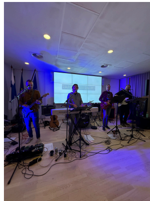
Finska representationens egna husband under ett kvällsevenemang, så kallat Häppärit, för de anställda