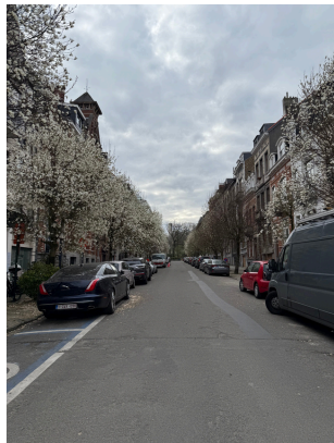
Ett annat vårtecken är alla blommande träd