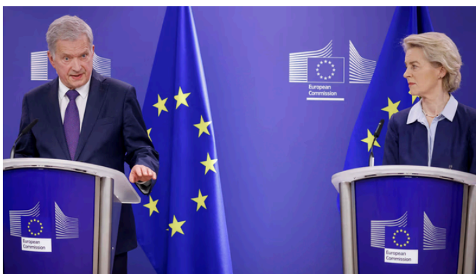
Sauli Niinistö, Finlands tidigare president och kommissionens ordförande Ursula von Der Leyen

Målet med denna strategi är att Europa ska vara så förberedda som möjligt inför alla sorters hot i framtiden. Genom att öka beredskapen i förberedande syfte strävar EU efter att bli en mera motståndskraftig och säker kontinent.