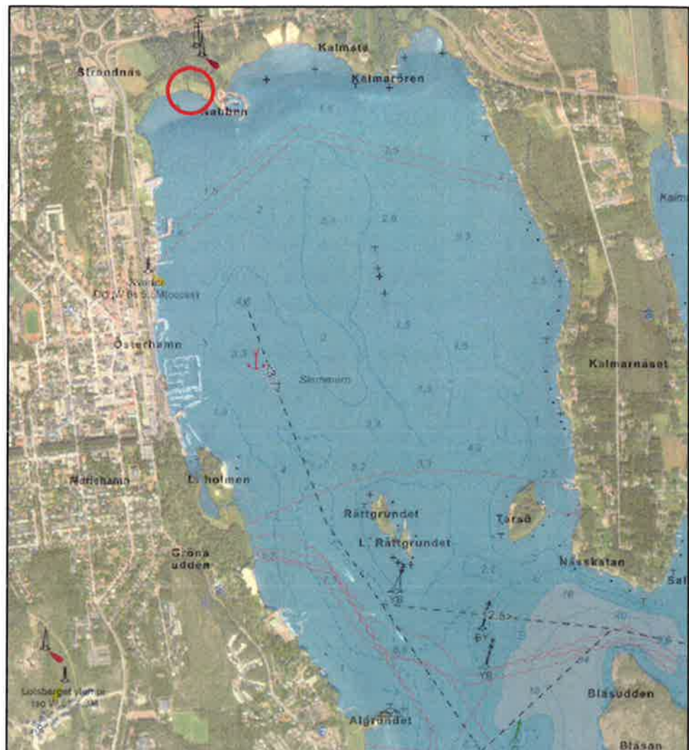
Figur 1. Dike med provtagningspunkt markerad med röd cirkel i Slemmern, Mariehamn.

Som en del av Ålands landskapsregerings miljöövervakning har NIRAS Sweden AB ombetts att genomföra en undersökning av föroreningsituationen i sediment utanför ett dagvattendike i norra Slemmern, Mariehamn, se Figur 1